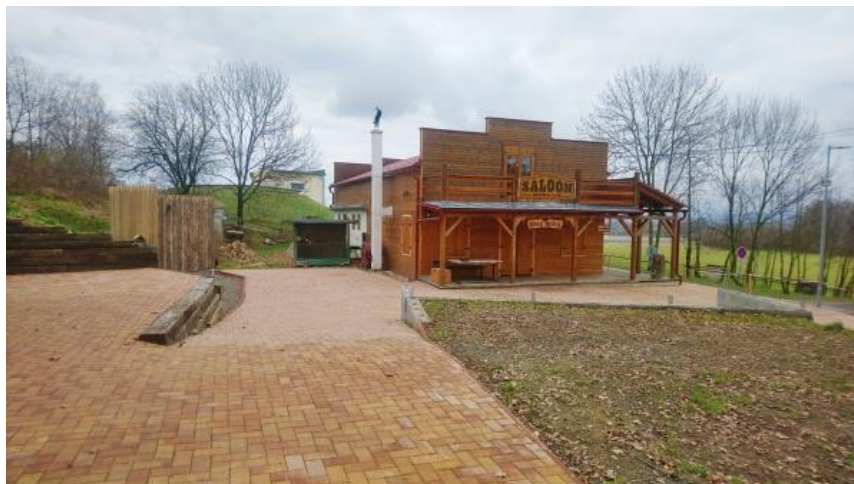
Za Western klub z.s. Ľudmila Tošovská